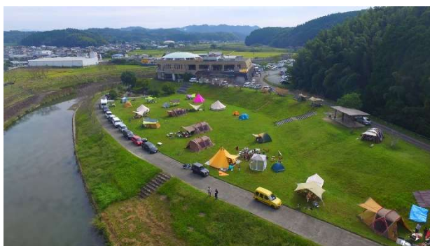
道の駅きくすい 菊水ロマン館、和水江田川カヌー・キャンプ場