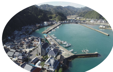
世界文化遺產“崎津集落”