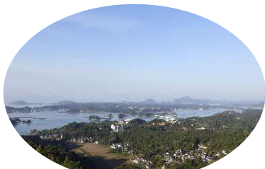
千歳山からの眺望