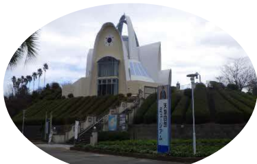
天草四郎ミュージアム