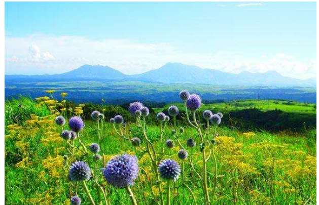
ヒゴタイ公園に咲くヒゴタイの花