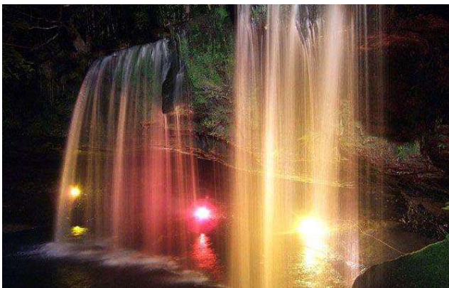
鍋ヶ滝のライトアップ

抜群の眺望と里山の雰囲気、黒川・杖立・満願寺を始めとした多様な温泉地を楽しめるルートです。