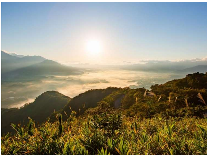
俵山展望所からの眺望

ルート内には道の駅「あそ望の郷くぎの」があり、阿蘇五岳の眺望を楽しみながらの休憩も可能です。