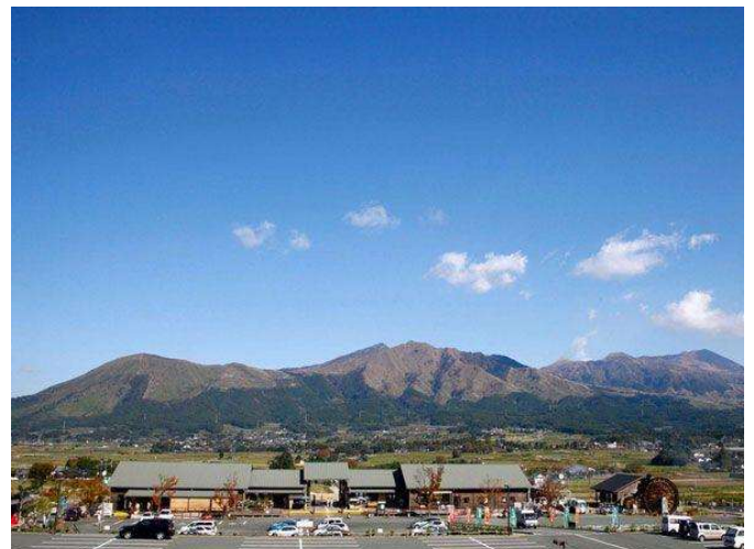
道の駅あそ望くぎの（阿蘇五岳）