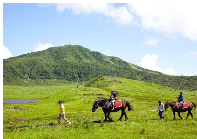
草千里ヶ浜（乗馬体験）