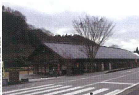
清和文楽邑物産館