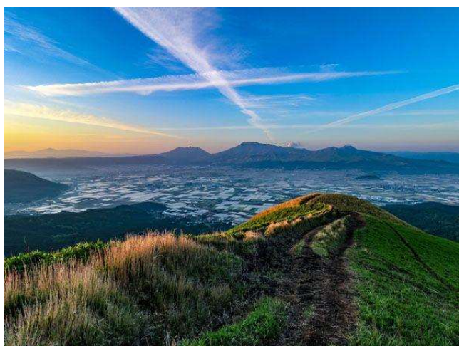
大観峰から望む阿蘇谷や阿蘇山の眺望

内牧温泉の日帰り湯、阿蘇神社での参拝、大観峰周辺や城山展望所からの阿蘇山の眺望なども楽しむことができます。