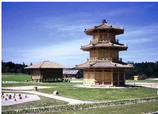
鞠智城跡（国史跡） 続日本100名城に選定された古代山城